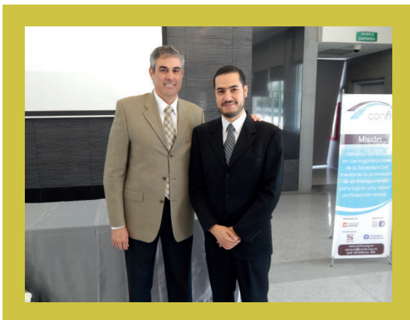
*Presidente y director de Confío, A.C.

Las otras organizaciones que participaron son: Espíritu de Campeón, A.C.; Proayuda a Niños con Cáncer Luz de Vida, A.C.; Asilo de Ancianos Rosa Loroño, I.A.P.; Fundación Mexicana para el Desarrollo Rural, A.C.; Fundación Pro-Empleo D.F., A.C.; México Unido contra la Delincuencia, A.C.; Residencia Rosa Fernández Veraud, I.A.P.; Trasplante y Vida, I.A.P.; Voluntarias Vicentinas de la Santa Cruz del Pedregal, A.C.; Unión de Empresarios para las Tecnologías en la Educación, A.C.; Banco de Alimentos y Enseres Unidos para Ayudar, A.C.; Fundación Casa Alianza México, I.A.P.; Fundación Rodrigo Montes de Oca, I.A.P. de la Ciudad de México; Club de Niños y Niñas de Nuevo León, A.B.P.; Fundación Besitos Salados, A.C.; Institución Renace, A.B.P. y Paz Es, A.B.P. de Nuevo León; Instituto Juvenil Saltilense, A.C. y Centro de Neurorehabilitación Betesda, A.C. de Coahuila y Estancia Alzheimer Dorita de Ojeda, I.A.P. de Sonora.