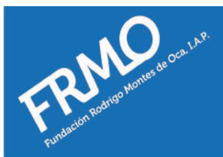
Colaborando para formar mejores mexicanos

Voluntarias Vicentinas de Ciudad Juárez. A.C.