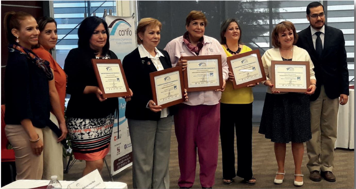
*Organizaciones reconocidas en Ciudad Juárez

Educación en Valores, A.C., quien compartió un breve testimonio sobre la experiencia de trabajar con el modelo de Confío.