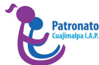
Patronato Cuajimalpa, I.A.P.