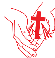
Casa Simón de Betania, A.C.