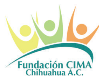
Fundación CIMA Chihuahua, A.C.