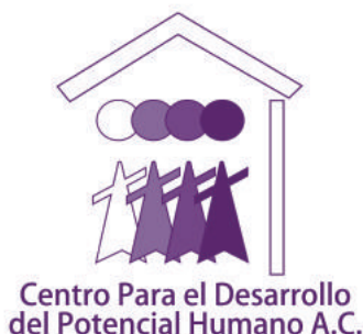
Centro para el Desarrollo del Potencial Humano, A.C.