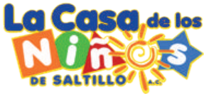
Patronato de la Casa de los Niños de Saltillo, A.C.