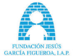
Fundación Jesús García Figueroa, I.A.P.