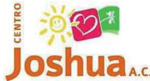
Centro Joshua Orientación para Mujeres, A.C.