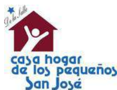
Instituto Juvenil Saltillense, A.C.