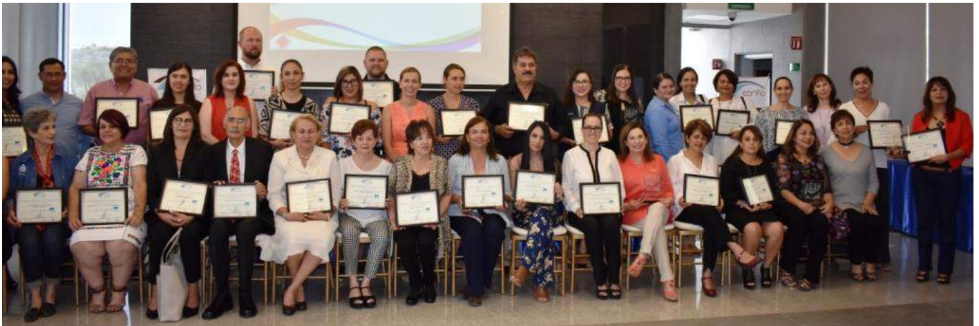
OSC reconocidas en la ciudad de Chihuahua

Chihuahua, Chihuahua.- Construyendo Organizaciones Civiles Transparentes, A.C. (Confío) reconoció a 48 organizaciones de la sociedad civil (OSC) de las ciudades de Chihuahua, Cuauhtémoc, Guerrero, Jiménez, Delicias, Camargo, Parral, Nuevo Casas Grandes y Ciudad Juárez por haber concluido satisfactoriamente su participación en el Modelo de Transparencia y Buenas Prácticas de Confío, posicionándose de esta manera como instituciones de confianza, comprometidas con la transparencia y la rendición de cuentas.