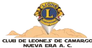
Club de Leones de Camargo Nueva Era, A.C.