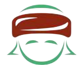
Apoyo con Cariño, A.C.