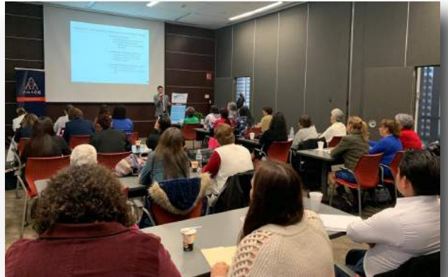
Taller Ciudad Juárez