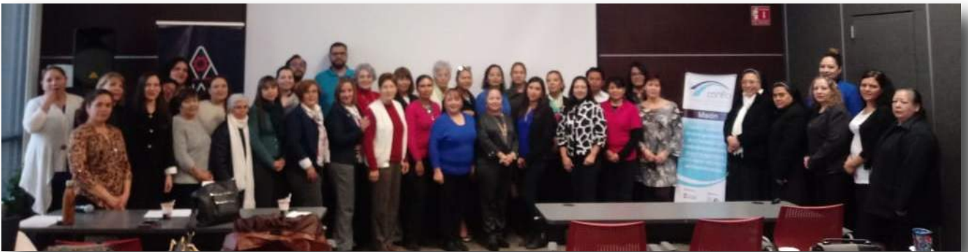
Asistentes Ciudad Juárez