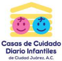
Casas de Cuidado Diario Infantiles de Ciudad Juárez, A.C.