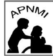
Asociación de Padres de Niños Mentalmente Inhabilitados