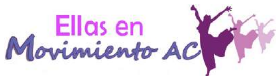
Ellas en Movimiento, A.C.