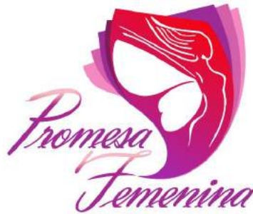
Promesa Femenina, A.C.