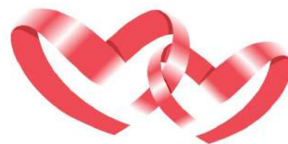
Corazones Unidos, Educando por la Niñez, A.C.