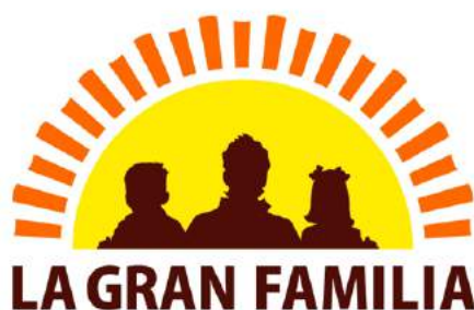
Casa Paterna La Gran Familia, A.C.