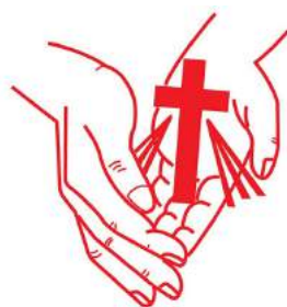
Casa Simón de Betania, A.C.