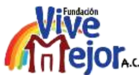
Fundación Vive Mejor, A.C.