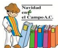
Navidad en el campo A.C.