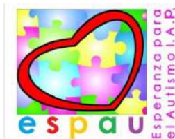
Esperanza para el Autismo, I.A.P.