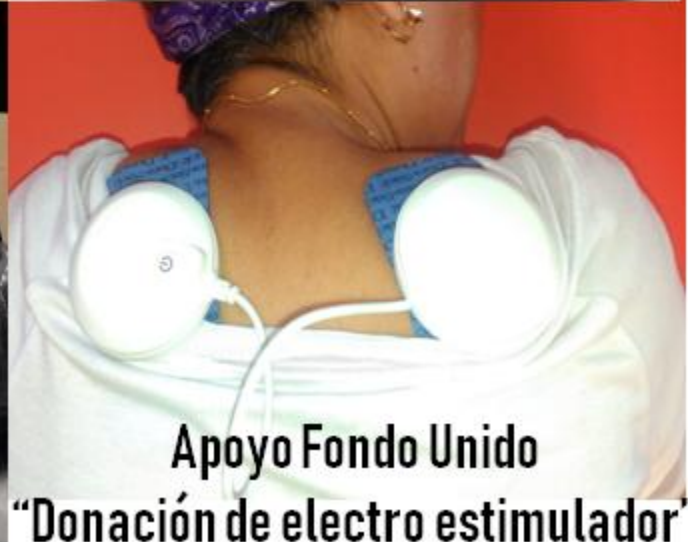
Apoyo Fondo Unido "Donación de electro estimulador"