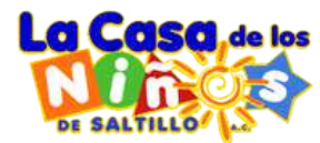
Patronato de la Casa de los Niños de Saltillo, A.C.