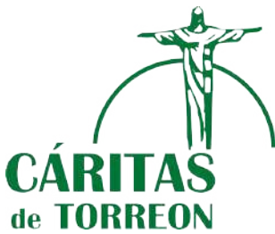
Cáritas Diocesanas de Torreón, A.C.