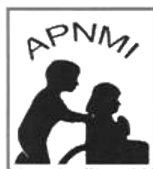
ASOCIACIÓN DE PADRES DE NIÑOS MENTALMENTE INHABILITADOS AC