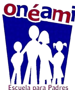
Centro de Formación y Orientación Familiar de Parral, A.C.