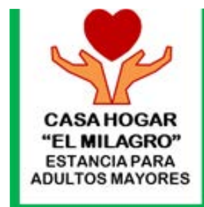
Casa Hogar El Milagro, I.A.S.P.