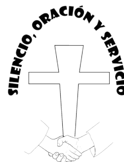
Grupo Unido al Servicio de los Indigentes, A.C.