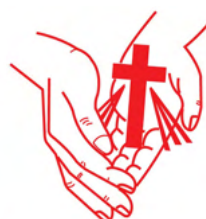
Casa Simón de Betania, A.C.