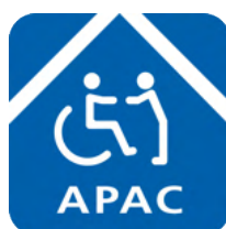
APAC, I.A.P., Asociación Pro Personas con Parálisis Cerebral