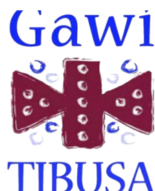
Complejo Asistencial Clínica Santa Teresita, A.C.