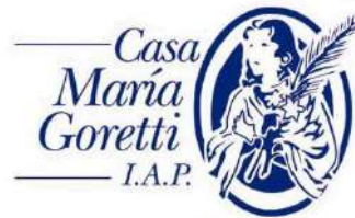
Casa María Goretti, I.A.P.