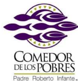
Juan XXIII al Servicio de los Pobres, A.C.