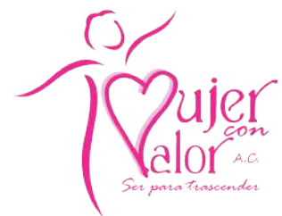
Mujer con Valor, A.C.