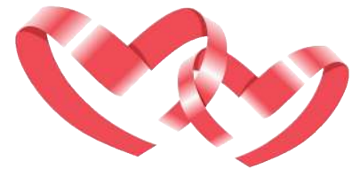
Corazones Unidos, Educando por la Niñez, A.C.