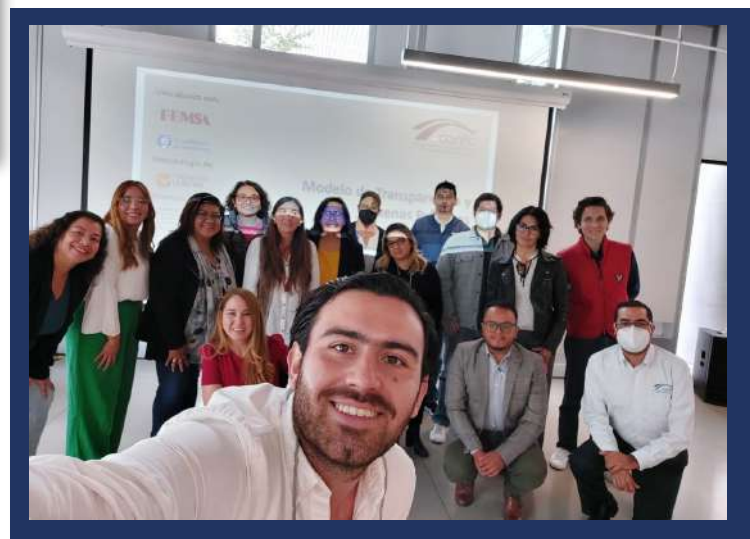
OSC participantes de CDMX