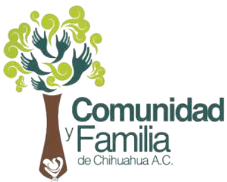
Comunidad y Familia de Chihuahua, A.C.