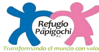
Refugio de Papigochi, A.C.