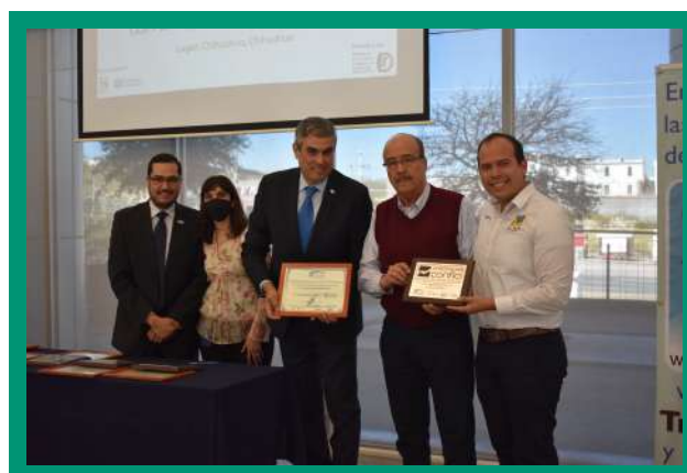
1,2,3 por mí y Parque Sacramento