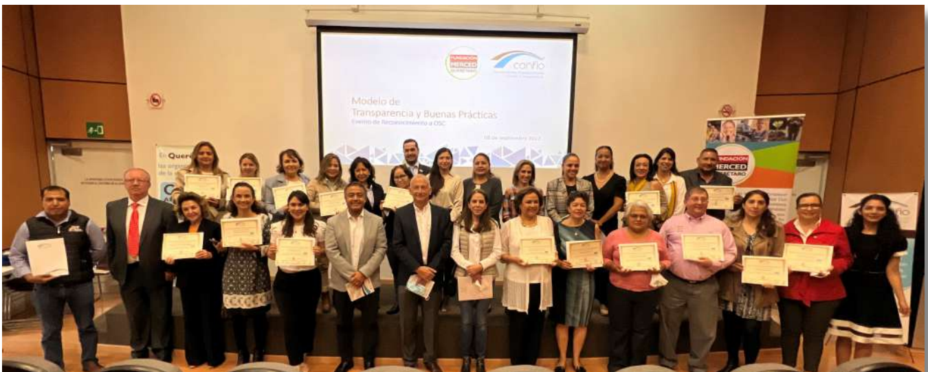
OSC reconocidas en Querétaro

Comprometidos con generar valor social, Fundación Merced Querétaro, en colaboración con la organización Construyendo Organizaciones Civiles Transparentes, A.C. (Confío), reconocieron a 18 instituciones que completaron su participación en el modelo de Transparencia y Buenas Prácticas de Confío, durante los años 2021 y 2022.