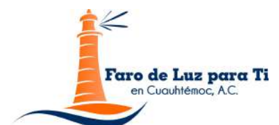
Faro de Luz para Ti en Cuauhtémoc, A.C.