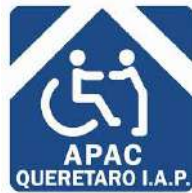
APAC Querétaro, I.A.P.