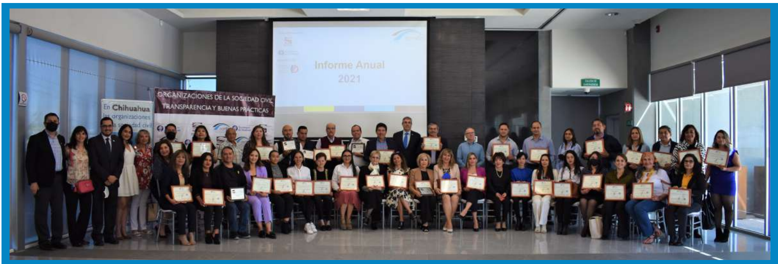
OSC reconocidas en la ciudad de Chihuahua

Construyendo Organizaciones Civiles Transparentes, A.C. (Confío) reconoció a 43 organizaciones de la sociedad civil (OSC) de las ciudades de Chihuahua, Ciudad Juárez, Cuauhtémoc, Delicias y Jiménez por haber concluido satisfactoriamente su participación en el Modelo de Transparencia y Buenas Prácticas de Confío, posicionándose de esta manera como instituciones de confianza, comprometidas con la transparencia y la rendición de cuentas.