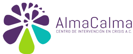
Centro de Intervención en Crisis Alma Calma, A.C.