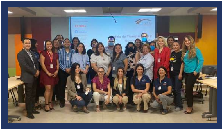
OSC participantes de Nuevo León

Agradecemos a Femsa por el impulso de la transparencia hacia la sociedad civil, gracias a su apoyo, desde 2015 hemos realizado 94 procesos de acreditación para #OSC de las regiones de Nuevo León y Ciudad de México.