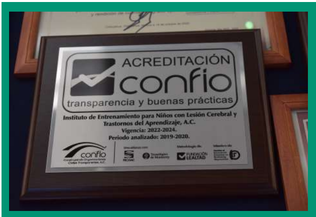
Reconocimiento de una organización acreditada

Asimismo, en el evento, se dio a conocer el nuevo logotipo de Acreditación para organizaciones, mismo que se otorgó a aquellas que tuvieron un cumplimiento óptimo en los 9 principios de transparencia y buenas prácticas: 1,2,3 Por mí y Parque Sacramento, A.C., Centro de Liderazgo y Desarrollo Humano, A.C., Fundación Social de la Asociación de Maquiladoras y Exportadoras de Chihuahua, A.C., Fundación Tarahumara José A. Llaguno, A.B.P., Girasoles, Centro de Desarrollo Integral para el Adulto Mayor, A.C., Instituto de Entrenamiento para Niños con Lesión Cerebral y Trastornos del Aprendizaje, A.C. y Vivir Bien en Delicias, A.C.