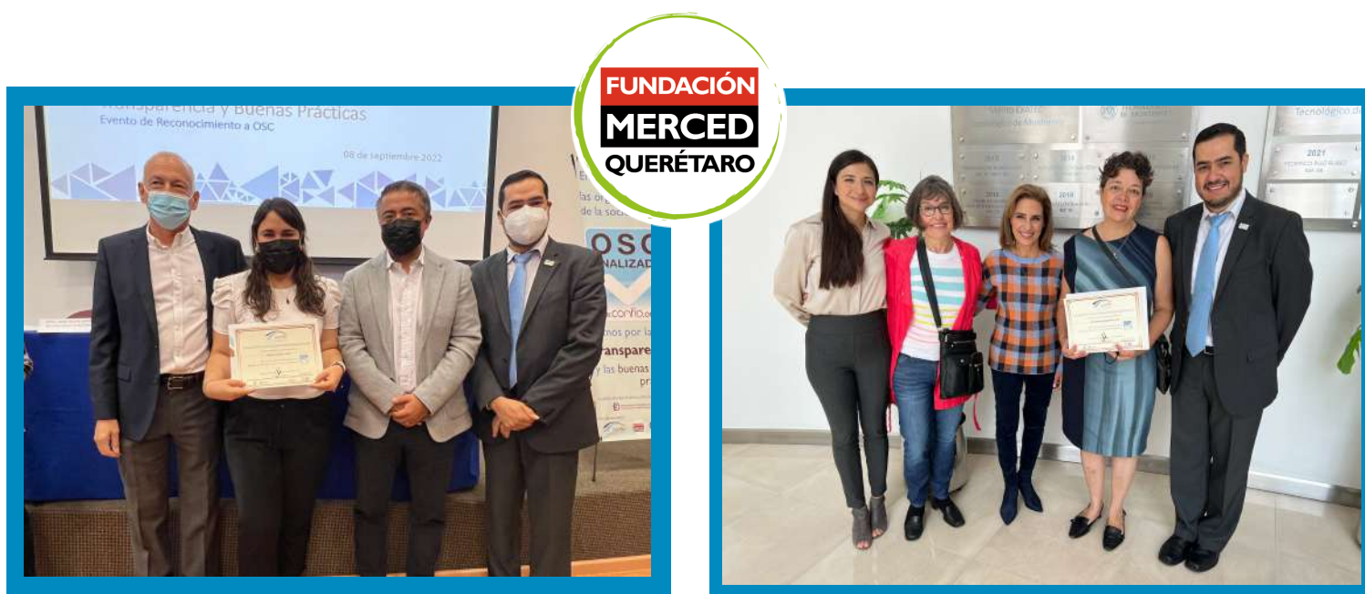
OSC reconocidas en Querétaro

Los reportes de las organizaciones analizadas y que están vigentes pueden ser consultados en el sitio web de Confío www.confio.org.mx .