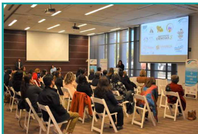
Asistentes en el evento