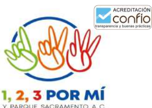
1,2,3 Por mi y Parque Sacramento, A.C.