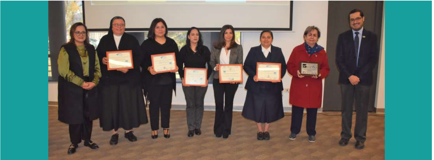
OSC reconocidas en Ciudad Juárez

Ciudad Juárez, Chihuahua a 01 de diciembre de 2022.- C o n s t r u y e n d o Organizaciones Civiles Transparentes, A.C. (Confío) reconoció a 10 organizaciones de la sociedad civil (OSC) de Ciudad Juárez y Casas Grandes por haber concluido satisfactoriamente su participación en el Modelo de Transparencia y Buenas Prácticas de Confío, posicionándose de esta manera como instituciones de confianza, comprometidas con la transparencia y la rendición de cuentas.