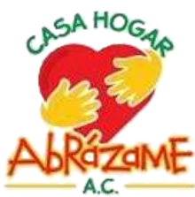
Casa Hogar Abrázame, A.C.