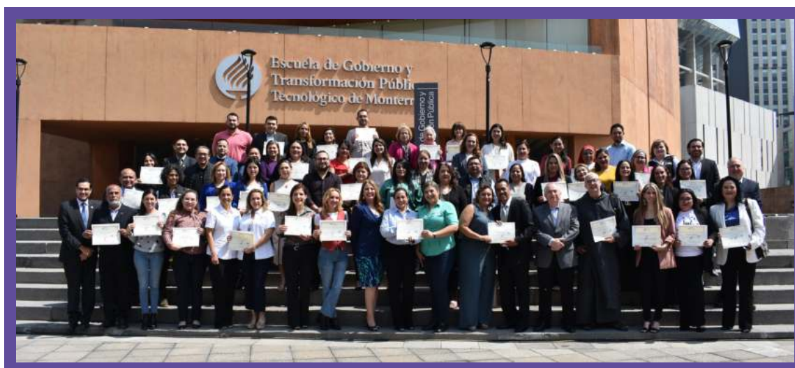
Organizaciones reconocidas en Nuevo León 2023

Asimismo, en el evento, se dio a conocer el nuevo distintivo de Acreditación para organizaciones, mismo que se otorgó a aquellas que tuvieron un cumplimiento óptimo en los 9 principios de transparencia y buenas prácticas: Asociación Regiomontana de Niños Autistas, A.B.P., Consejo Cívico de Instituciones de Nuevo León, A.C., Cruz Rosa, A.B.P., Effeta, A.B.P., Formar y Educar a la Persona, A.C., Fundación Zaber, A.C., Mujer en Plenitud, A.B.P., Parque Ecológico Chipinque, A.B.P., Patronato de la Casa de los Niños de Saltillo, A.C. y Unidas Contigo, A.C.