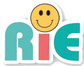
Recepción, Integración y Expresión, A.C.