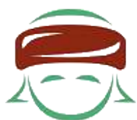
Apoyo con Cariño, A.C.