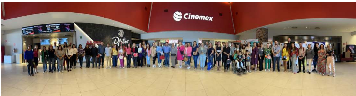
Participantes de la Red se Mueve 2023