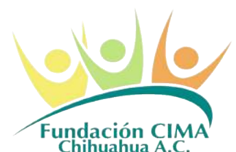
Fundación CIMA Chihuahua, A.C.