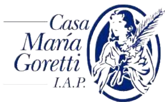
Casa María Goretti, I.A.P.