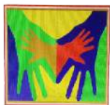
Centro de Orientación y Apoyo Familiar y Social de Jiménez A.C. Centro de Orientación y Apoyo Familiar y Social de Jiménez, A.C.