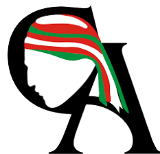
Centro de Acopio para la Tarahumara, A.C.