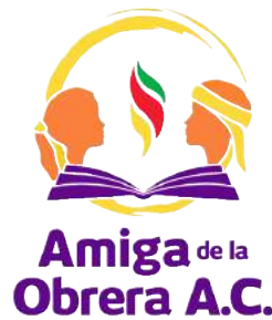
Amiga de la Obrera, A.C.