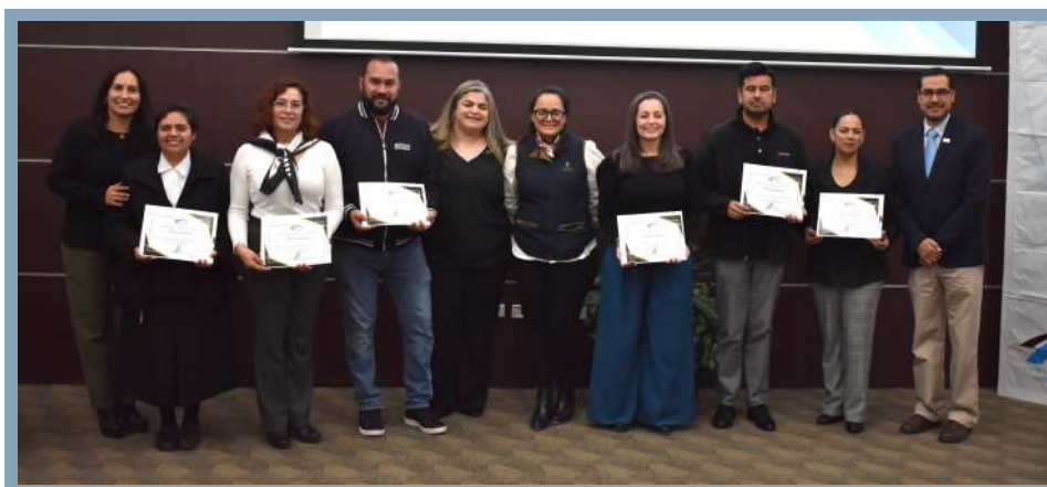
OSC reconocidas a través del programa de acompañamiento al fortalecimiento