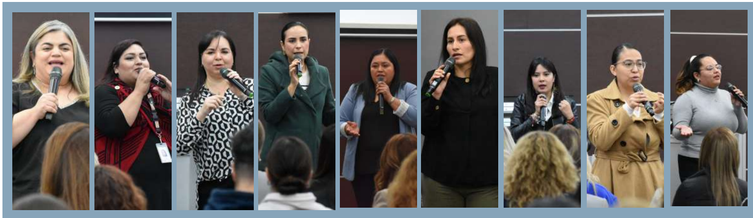
Expositoras del Foro de Donantes

Ciudad Juárez, Chihuahua, 09 de diciembre de 2024.- En un importante encuentro celebrado en las instalaciones de Fechac Juárez, Construyendo Organizaciones Civiles Transparentes, A.C. (Confío) organizó un foro para donantes y OSC, espacio diseñado para conectar a las organizaciones de la sociedad civil con potenciales aliados estratégicos.