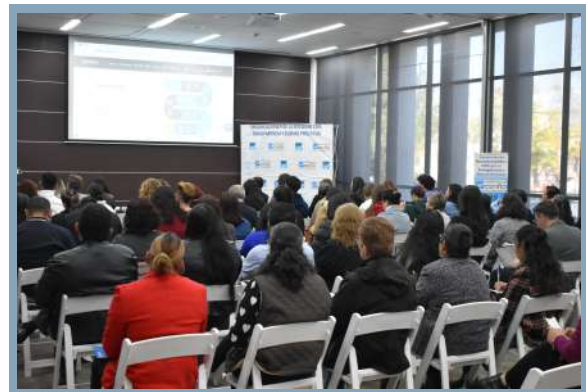
Asistentes en el evento