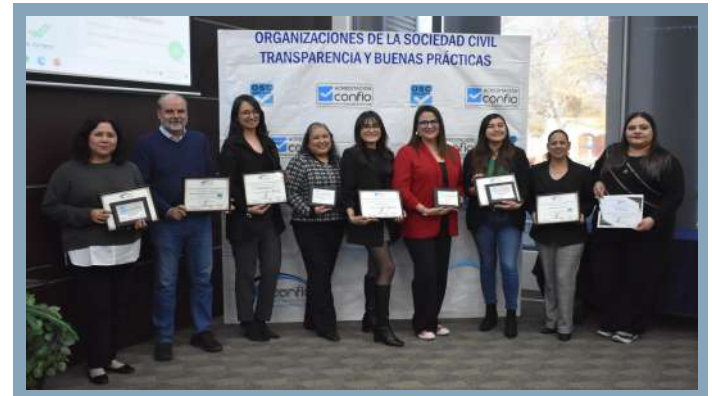
OSC reconocidas por culminar con éxito su participación en el modelo de Transparencia y Buenas Prácticas.

Con este tipo de iniciativas, Confío reafirma su compromiso de brindar mayores herramientas de procuración de fondos a OSC analizadas en Ciudad Juárez. Al facilitar el encuentro entre donantes y organizaciones civiles, se impulsa el desarrollo de proyectos sociales innovadores y se contribuye a la construcción de una comunidad más justa y equitativa.